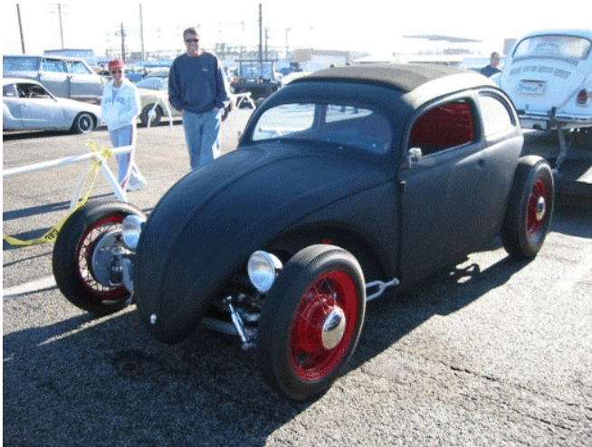
Denne tror jeg ville stilt i UFO-klassen på Trøndertræff