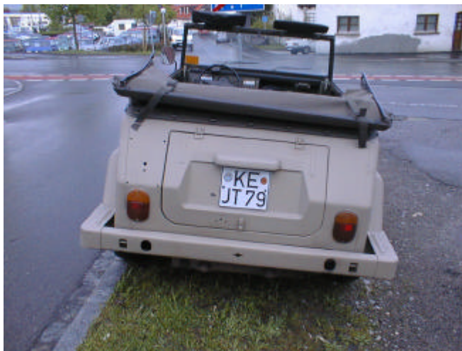
Den militære utgaven av VW 181 har baklys fra en gammel type 2

Forhjulsoffenget ligner på forhjulsoffenget på 1300, med enkelte modifikasjoner. Bagasjeplassen er begrenset, men den eksisterer.