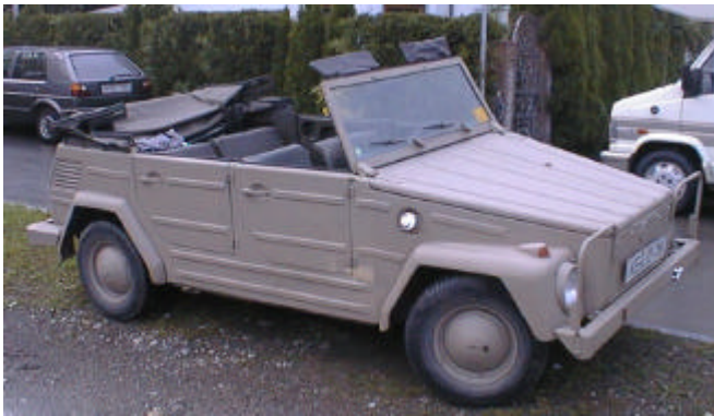
Nils Ståles 181 slik den så ut da Nils Ståle kjøpte den.

Volkswagens Gang ønsker Nils Ståle lykke til, og ønsker ham og Type 181en hjertelig velkommen til Trøndertræff 2004.