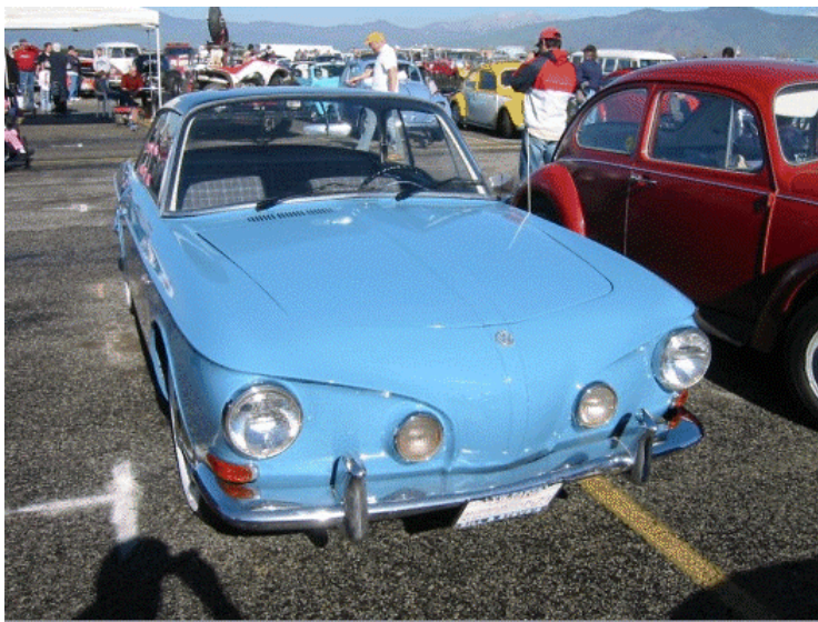
Type 3-Ghia