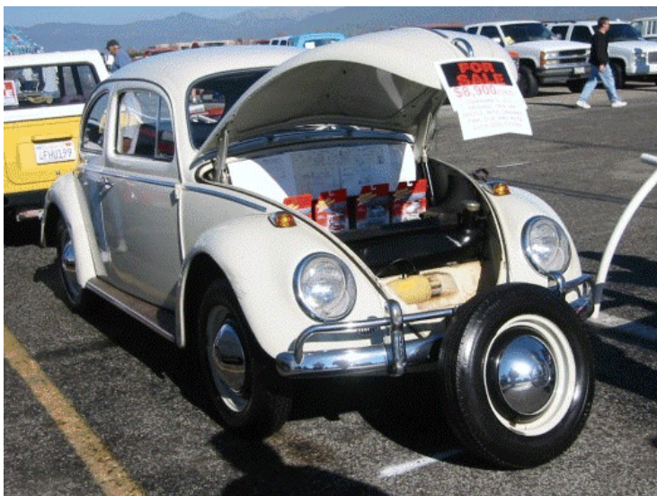
En mulighet for å gjøre et godt (?) kjøp. $8900+frakt