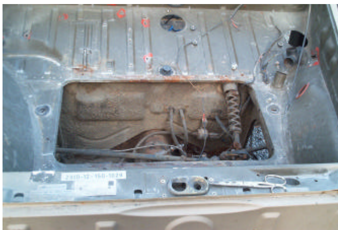
Bagasjeromspllassen er begrenset med alt på plass

Forhjulsoffenget ligner på forhjulsoffenget på 1300, med enkelte modifikasjoner. Bagasjeplassen er begrenset, men den eksisterer.