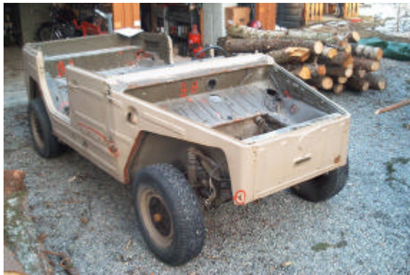
Nils Ståles 181 slik den ser ut i dag

Inne i garasjen stod så opphavet til alle ryktene, uten dører, panser, seter og innredning.