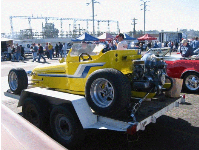
Sånn kan det også gjøres

Et av våre medlemmer, Erik Dragsnes, har vært på Pomona Swap Meet i USA. Han har sendt oss disse bildene. Resten av bildene hans finner du på http://foto.vg.no/fotoalbum.php?aid=141499